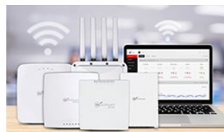
Wi-Fi Seguro en la Nube