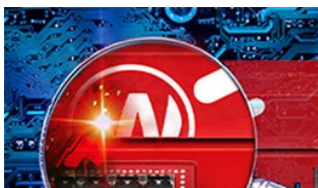
Seguridad de Red